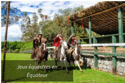
Jeux équestres en Equateur