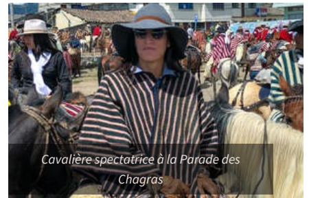
Cavalière spectatrice à la Parade des Chagras