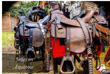
Selles en Equateur