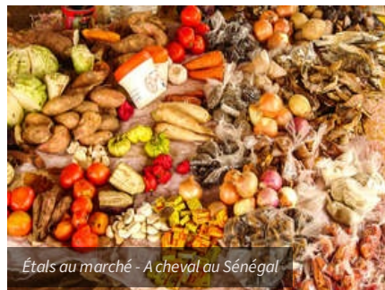
Étals au marché - A cheval au Sénégal