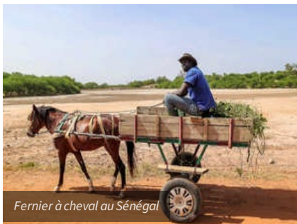
Fernier à cheval au Sénégal