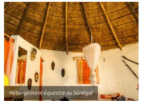
Hébergement équestre au Sénégal