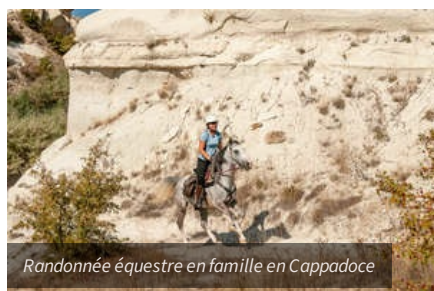
Randonnée équestre en famille en Cappadoce