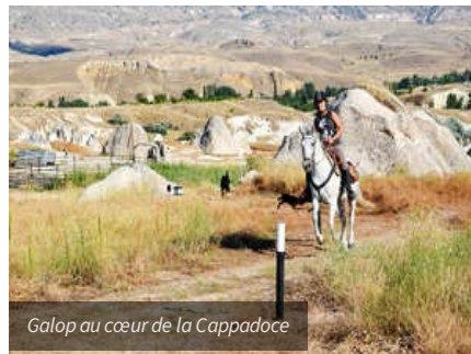
Galop au cœur de la Cappadoce