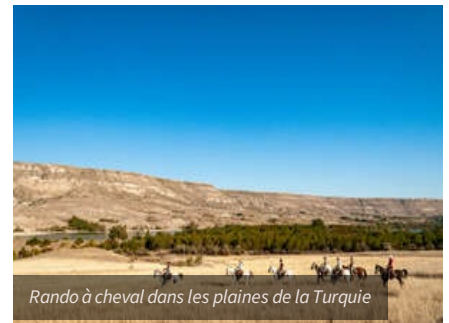
Rando à cheval dans les plaines de la Turquie