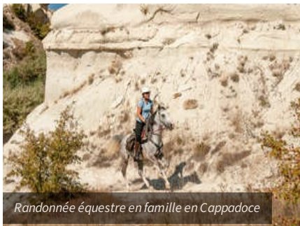
Randonnée équestre en famille en Cappadoce