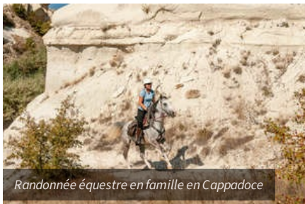
Randonnée équestre en famille en Cappadoce