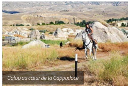
Galop au cœur de la Cappadoce