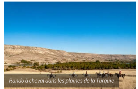
Rando à cheval dans les plaines de la Turquie