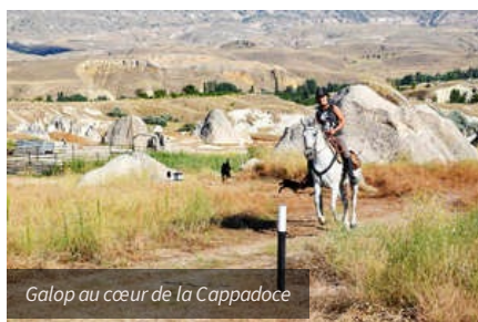
Galop au cœur de la Cappadoce