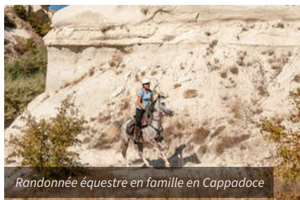
Randonnée équestre en famille en Cappadoce