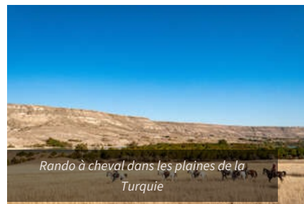
Rando à cheval dans les plaines de la Turquie