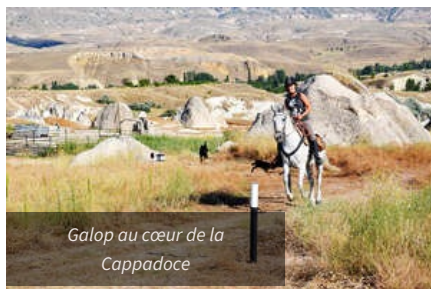
Galop au cœur de la Cappadoce