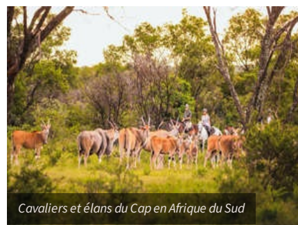
Cavaliers et élans du Cap en Afrique du Sud