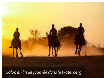
Galop en fin de journée dans le Waterberg