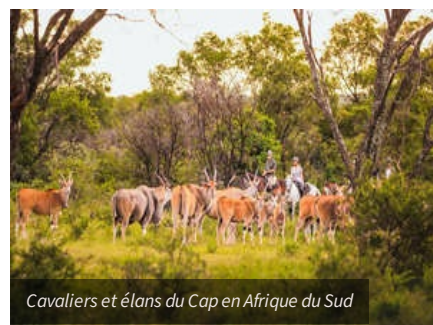
Cavaliers et élans du Cap en Afrique du Sud