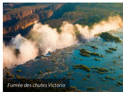
Fumée des chutes Victoria