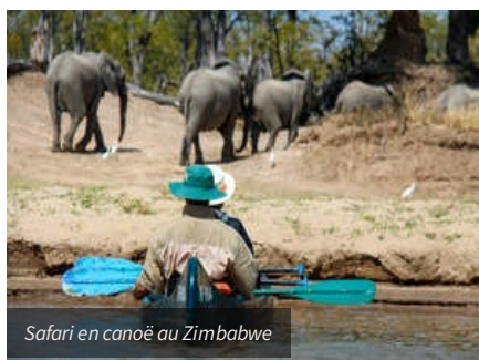
Safari en canoë au Zimbabwe