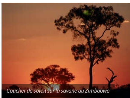
Coucher de soleil sur la savane au Zimbabwe