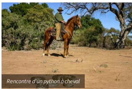
Rencontre d'un python à cheval