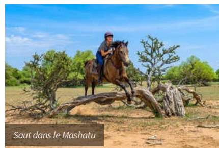
Saut dans le Mashatu