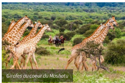
Girafes au coeur du Mashatu