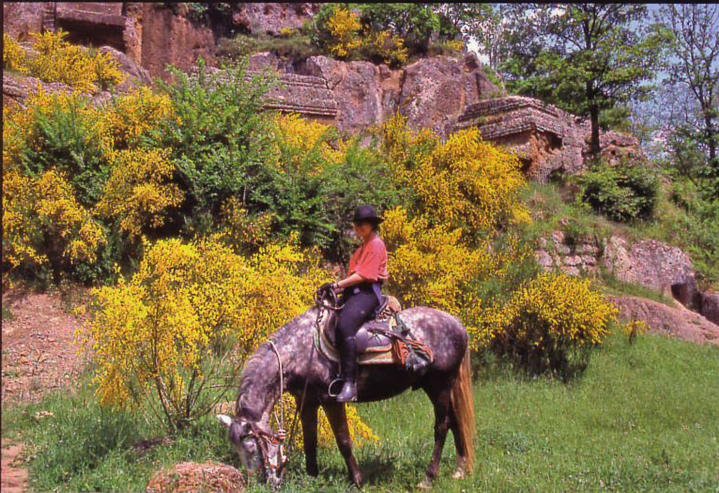
Randonner à cheval N° 15

La région regorge de sites archéologiques datant de l'époque des Etrusques. Les cavaliers « abandonnent » les chevaux pour poursuivre la visite à pied.