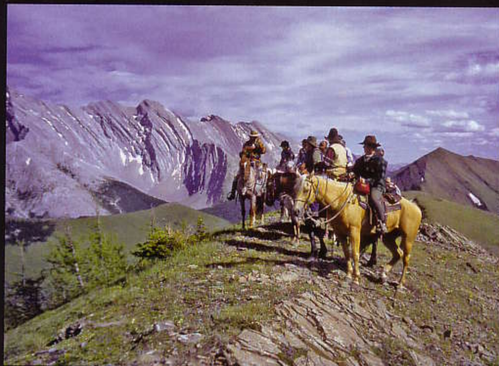
Et puis à la limite des forêts c'est le jaillissement souverain, l'épine dorsale des Rocheuses entre Alberta et Colombie Britannique

Un large chemin herbeux illuminé des bouquets rouges des indian paintbrush, devient sentier, suit un torrent, traverse une clairière et redevient piste moelleuse pour un beau galop puis s'enfonce dans une forêt épaisse et grimpe, grimpe encore pour déboucher au grand soleil dans une vaste prairie, tapissée de fleurs comme s'il en pleuvait : gracieuses ancolies jaunes, potentilles radieuses, éclair amarante des shooting stars, anémones pulsatiles, lupins... l'été éclate de mille couleurs. Nous progressons vers le col de Boulton, la pente se raidit encore, nous nous mettons en suspension vers l'avant - pas évident sur une selle américaine... - rênes longues, les chevaux allongent l'encolure, plantent énergiquement la pince des antérieurs et poussent vigoureusement de l'arrière-main. La végétation se raréfie laissant la roche calcaire à nu, on y reconnaît des formations coralliennes hissées à cette altitude de 2400m par quelque puissant soubresaut tellurique. Des épicéas à l'al-